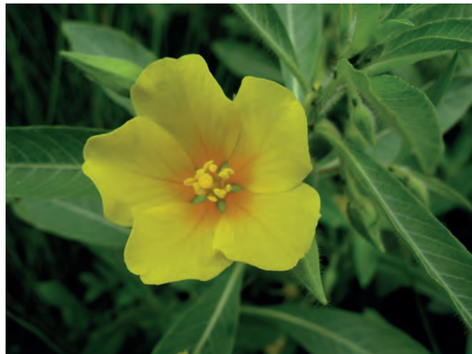
La Jussie grandes fleurs ( Ludwigia grandiflora , Onagracées)

Les feuilles sont luisantes et alternes. À la base de l'insertion des feuilles sur la tige, existe un petit organe foliacé