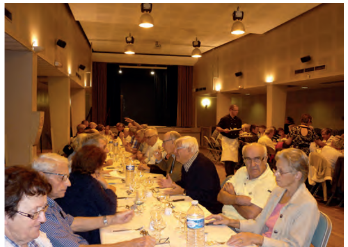
Et... cette matinée studieuse s'est terminée, comme il se doit, par un repas où plus de 80 convives se sont installés autour des tables de la salle Marie Laurent.

La séance est close. Le Président invite les participants à partager le verre de l'amitié.