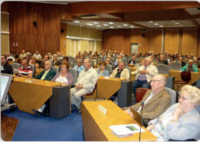
Une vue de l'assemblée.

relève des tribunaux civils. Par ailleurs, il faut démontrer qu'il y a préjudice.