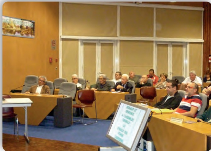
Une vue de l'assemblée.

M. MONS : à la demande d'introduction de la « carpe amour », l'administration a donc regardé la configuration de l'étang et le physique et a fait l'amalgame. Il n'a pas l'autorisation d'introduire