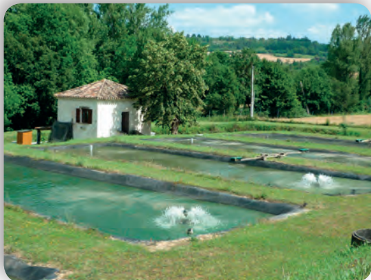
Les oxygénateurs en service.

Tous, nous avons été très attentifs à ses nombreuses explications qui nous ont permis de découvrir l'élevage du black-bass.