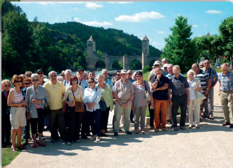
Le groupe avec à l'arrière-plan le pont de Valentré.

C'est dans cette chaude ambiance que chacun descend du car en remerciant bien cordialement les organisateurs et en leur faisant promettre un « à l'année prochaine » !