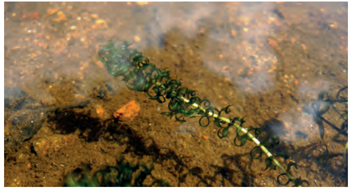
L'Élodée de Nuttall ( Elodea nuttallii , Hydrocharitacée) Espèce à risque invasif intermédiaire : cotation 24, échelle de Weber. Espèce émergente : cotation 2, échelle de Lavergne.

Description : Plante herbacée aquatique vivace, submergée. Elle présente des tiges grêles ramifiées entre 20 et 30 cm de