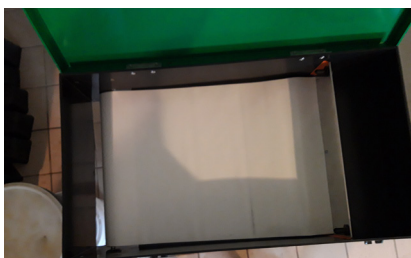
Nourrisseur à tapis

Pour calculer la quantité de nourriture nécessaire : Poids du poisson dans l'étang x 1,5 à 2 (Exemple : pour 50kg de poisson dans son étang il faut acheter entre 75kg et 100kg de nourriture)